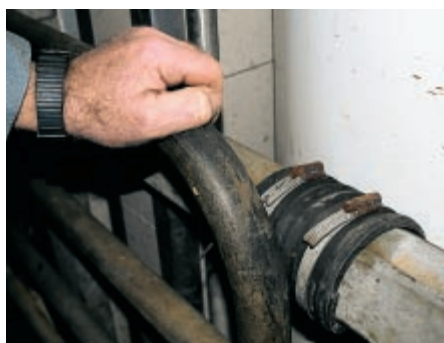
Wo beim Öffnen und Schliessen Metall auf Metall trifft, kann mit einfachen Massnahmen ...