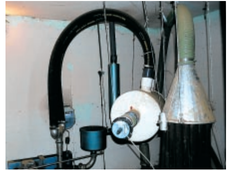
Der Vibrationsschlucker, bestehend aus Schläuchen, Vakuumtank und Trennstrecke, ist aufgehängt.

Er hat die Pulsatoren von der Luftleitung abgetrennt und an den Schlauchenden befestigt. Diese sind am zusätzlich installierten Puffertank angeschlossen und hängen frei herunter. Wie es der Name sagt, fängt der Puffertank die Druckwellen der Pulsatoren auf und verhindert, dass dieser zum Regelventil und in die Milchleitung weitergeleitet wird. Den Puffertank und die Verbindungsschläuche zu den Pulsatoren hat er gänzlich mit schallisolierendem Material eingekleidet.