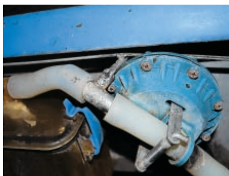
Die Übergangsstücke der Milchschräume wurden mit Chromstahl an die Erdung geschweisst.