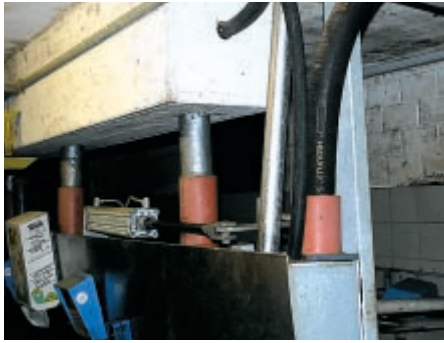
Die Pulsatoren hat Beat Heini freihängend an Schläuchen montiert. Oben ist der Puffertank.