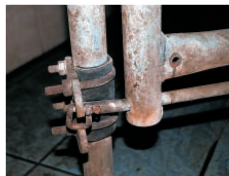
... wie einer Gummiummantelung der Lärm stark reduziert werden.